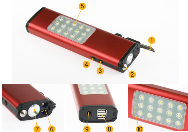
Рисунок 1. Описание устройства